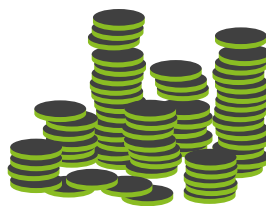
Coste muy elevado