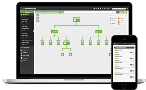
Vista Consola de Pandora FMS

del servicio de su infraestructura al completo. Esto significa no tener que esperar a ver los datos en la pantalla ni tener más datos fragmentados, lo cual se traduce en una mayor eficiencia de los equipos de operación.